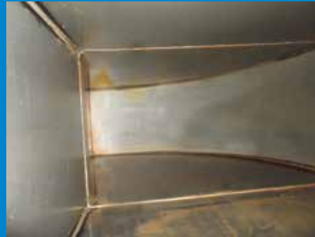
» Gereinigter Kanal nach fachgerechter Behandlung durch unser Unternehmen. «