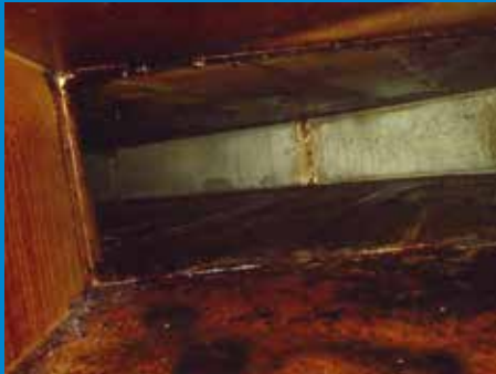
» Verschmutzter Kanal wie es auch bei Ihnen vorliegen kann. «

» Einhaltung der gesetzlichen Richtlinien «